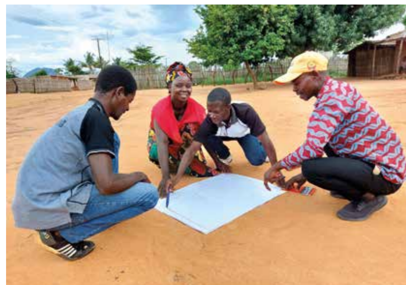
Wasserkomitees kümmern sich auch in Zukunft um die Instandhaltung von Brunnen, Bohrlöchern und Wasserstellen.

hen, etwa bei den ersten Anzeichen von Malaria.“